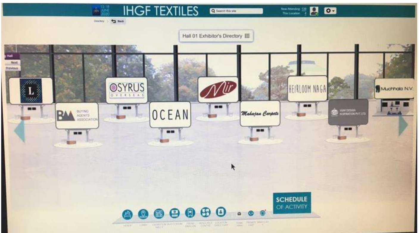
BOOTH SET UP AT IHGF-TEXTILES VIRTUAL FAIR