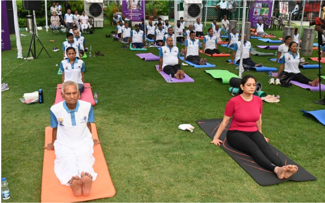
Photo 4: Participant performing yoga during EPCH – FASCO 9th International Day of Yoga held on 21.06.2023 at New Delhi.