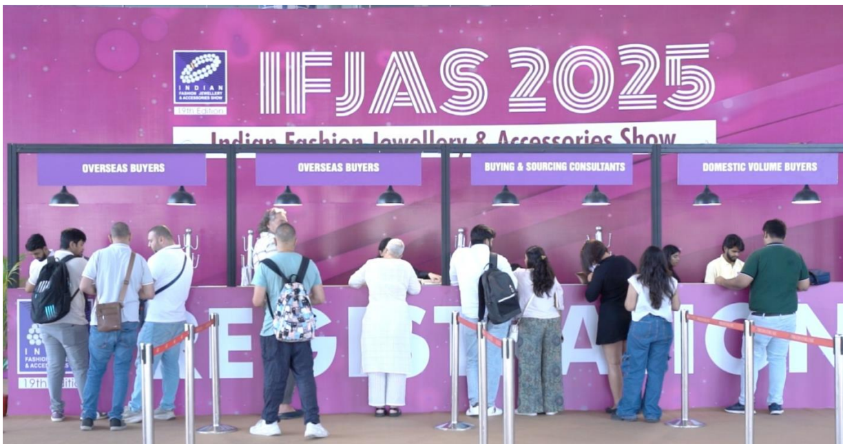
Photo 1 & 2: Buyers inflow in progress during day 3 rd of IFJAS'25 at IEML, Greater Noida