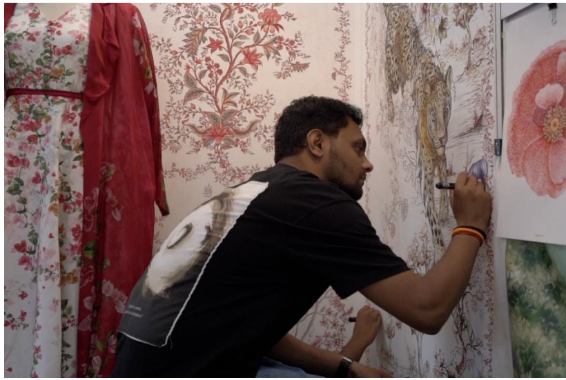
Photo 6: Live craft demonstration by craftperson during 19 th IFJAS'25 at IEML, Greater Noida