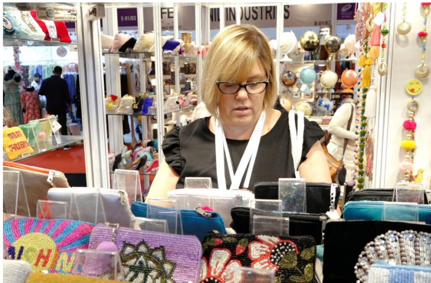
Photo 3, 4 & 5: Sourcing and on the spot business generated during 19 th IFJAS'25 at IEML, Greater Noida