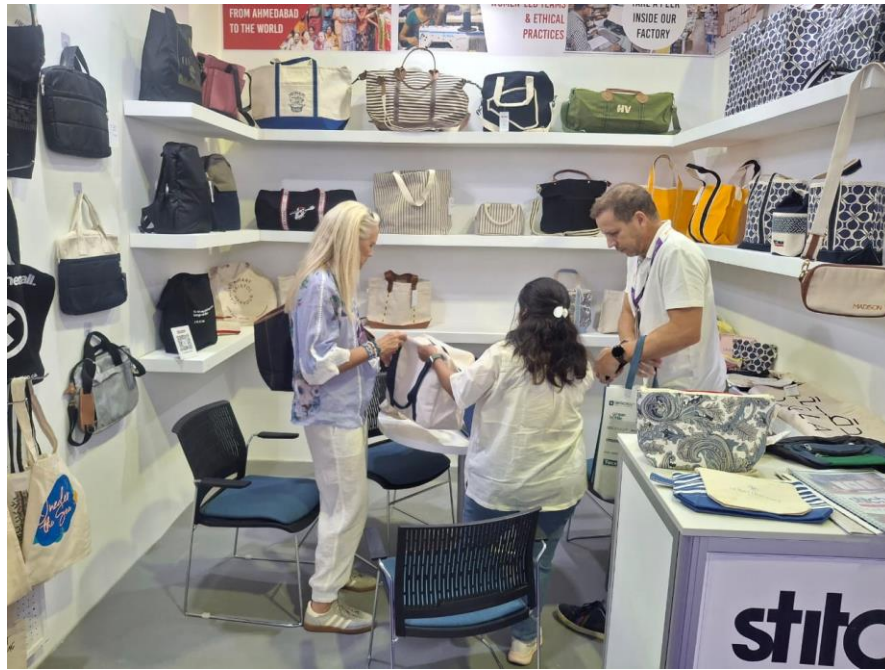
Photo 5: Visitors doing business enquiries with EPCH exhibitors at EPCH India pavilion during Gifts & Lifestyle Middle East 2025, Dubai, UAE.